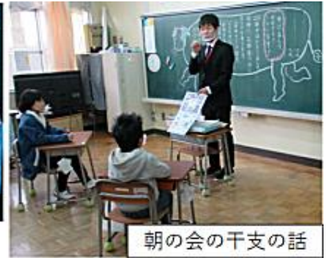
朝の会の干支の話

しぎょうしき こんかい じぜん へんしゅう あいさつどうが かくきょうしつ しちょう おこな 始業式は、今回も事前に編集した挨拶動画を各教室で視聴して行いました。