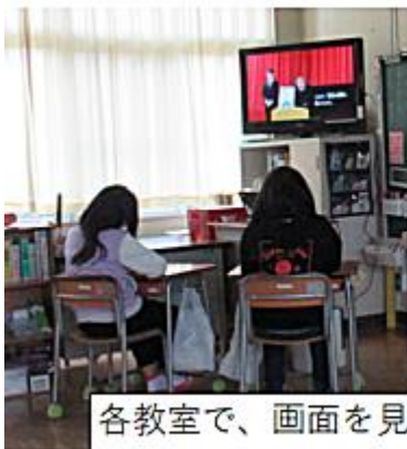
各教室で、画面を見て始業式をしました。