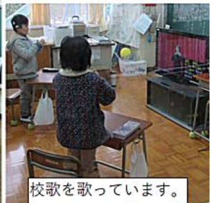
校歌を歌っています。

みな がっき げんき えがお がんば 皆さん、3学期も元気に笑顔いっぱい頑張らしましょう。